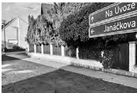
Opravilo se také několik stovek metrů chodníků.

Hustopeče velká rekonstrukce kuchyně a jídelny ZŠ Komenského v hodnotě několika desítek milionů korun. Budou se opravovat hřiště, jedno zbrusu nové vznikne i v nové zástavbě na Křížovém vrchu. Budou se demolovat bývalé vepřiny, opravovat chodníky, fasáda společenského domu i střecha ZŠ Nádražní. „Z těch větších akcí je potřeba zmínit vybudování zázemí pro dětské skupiny, což obnáší demolici stávajícího a vybudování zbrusu nového objektu v ulici Javorová. Co nebude tolik vidět, jsou přípravy na rozšiřování čistírný odpadních vod, které nás jako město v následujících letech neminou. V roce 2025 proto budeme opravovat hlavní most přes Štinkovku,“ zmiňuje starostka Hana Potměšilová.