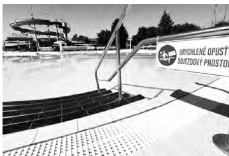
Rekonstrukci má za sebou také místní koupaliště.

Kromě zelených projektů, které jsou jednou z priorit města do dalších let, čeká