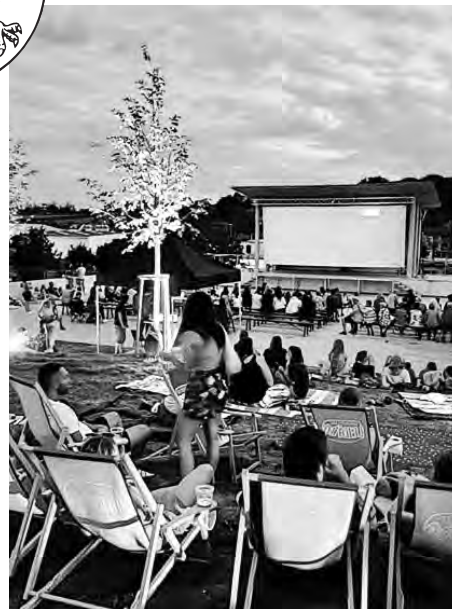
Amfiteátr již zažil první hody, letní kino i Burčákové slavnosti.