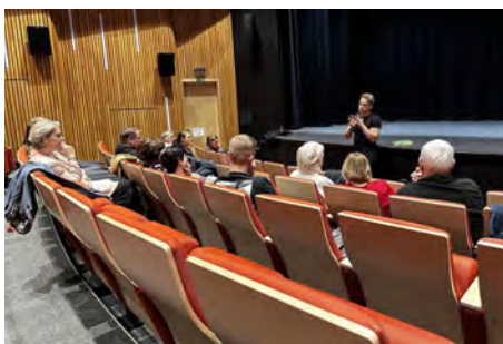
Na besedě o dezinformacích se řešila důležitá témata.

9. 1. Ve čtvrtek 9. ledna se v sále hustopečského kina konala beseda s názvem „Jak na (dez)informace kolem nás?“, kterou vedl