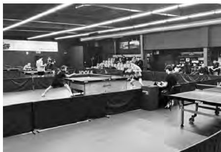
Foto z posledního utkání s celkem Havířova.