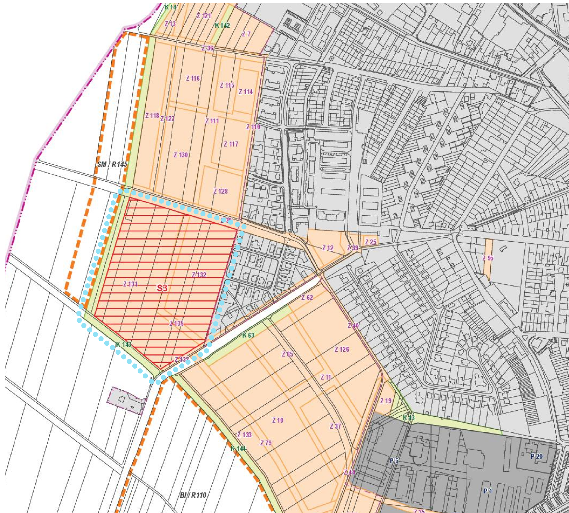
ÚZEMNÍ PLÁN HUSTOPEČE (2021) - Úplné znění po Změně č.3 ZÁKLADNÍ ČLENĚNÍ ÚZEMÍ - výřez